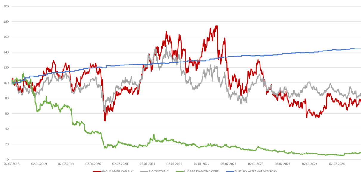
DIAMOND EXPOSED PERFORMANCES 1st JUL 2018 – 31st DEC 2024 3 major traded shares versus BLUE SKY ALTERNATIVES SICAV, all calculated in USD

Im Vergleich mit börsennotierten Aktien von spezialisierten Produzenten und Verarbeitern bzw. etwas diversifizierter aufgestellten grossen Minenkonzernen schneidet der Fonds (Bloomberg: VALBSAE LE) im Quervergleich, vor allem durch seine geringere Volatilität, seit dessen Erstaussgabe sehr gut ab: